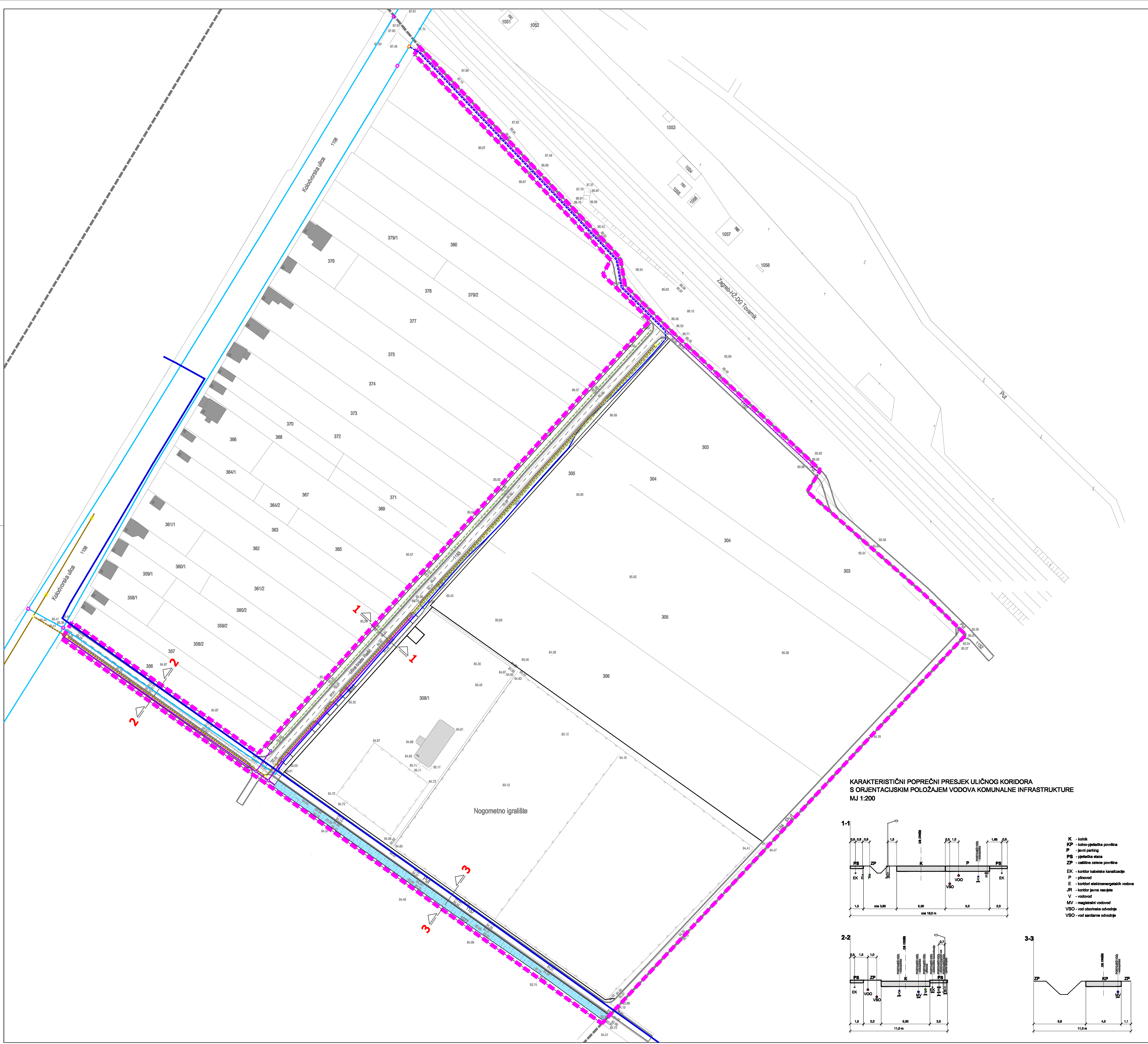
KARAKTERISTIČNI POPREČNI PRESJEK ULIČNOG KORIDORA S ORIJENTACIJSKIM POLOŽAJEM VODOVA KOMUNALNE INFRASTRUKTURE MJ 1:200